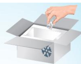
Put into container