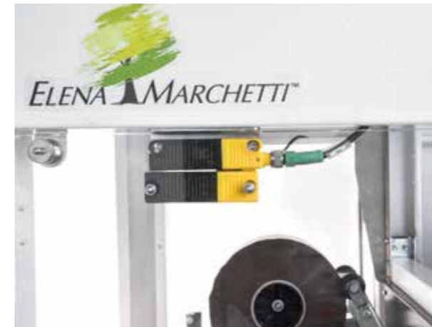
◀ Micro RFID a codifica unica. Unique coding RFID.