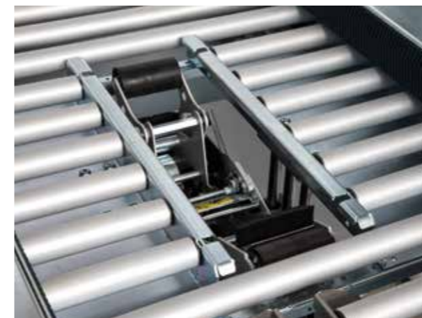
◀ Sistema di esclusione della testa nastrante inferiore. Disable device of bottom taping head.