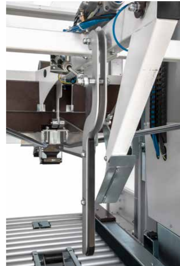
▲ Gruppo tastatore e raddrizza falde. Integrated touch probe and flap orientating device.