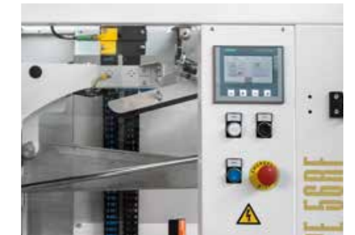
▲ Pannello di controllo. Electronic panel.