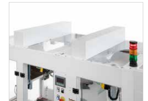
▲ Vista macchina dall'alto. Top view machine.