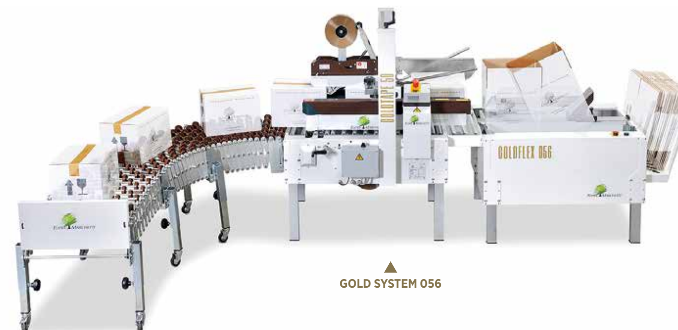
▲ GOLD SYSTEM 056