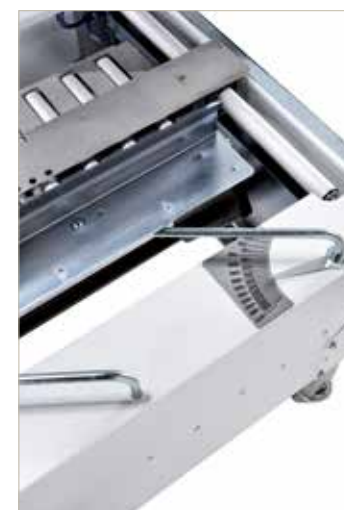
▲ REGOLAZIONE LARGHEZZA SCATOLA ADJUSTMENT BOX WIDTH