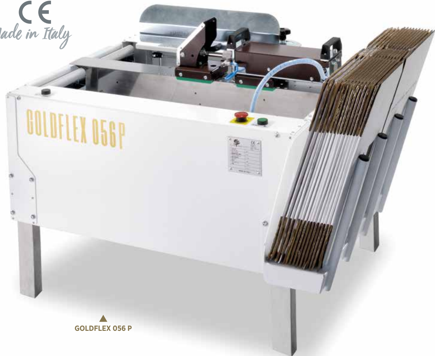
▲ GOLDFLEX 056 P