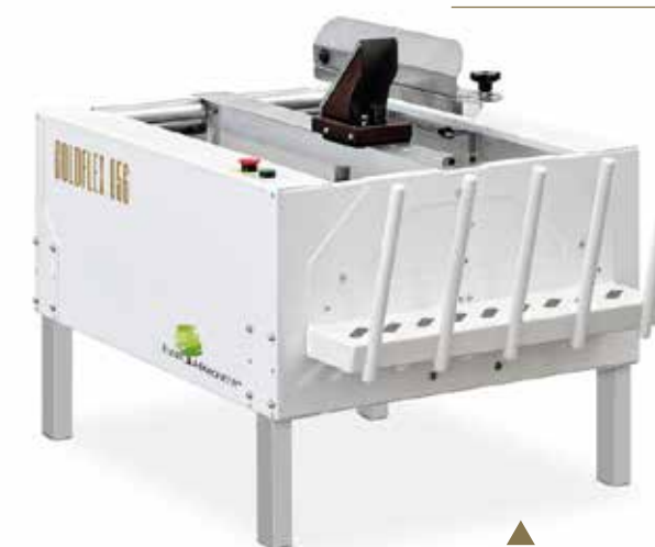
▲ GOLDFLEX 056